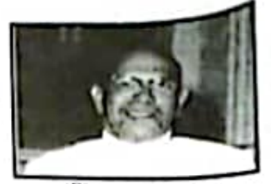
(B) (4 புள்ளிகள்)