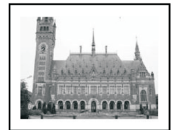
B (04 புள்ளிகள்)