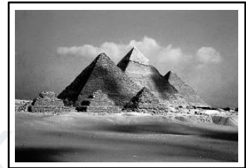
(ලකුණු 1 x 4 යි.)

(i) මෙම පිංතූරයේ දැක්වෙන කාන්තාව නම් කරන්න.