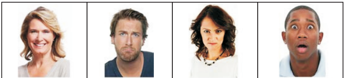
A B C D