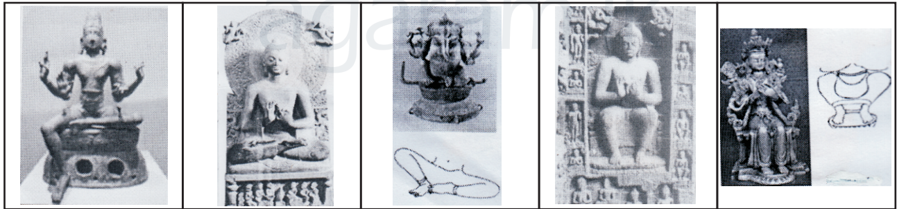
A B C D E

● ප්‍රශ්න අංක 11 - 15 තෙක් පහත දී ඇති පින්තූර භාවිතයෙන් සමීප සම්බන්ධතාවයක් ඇති වාක්‍ය ඉදිරියෙන් අදාළ අක්ෂරය ලියන්න.